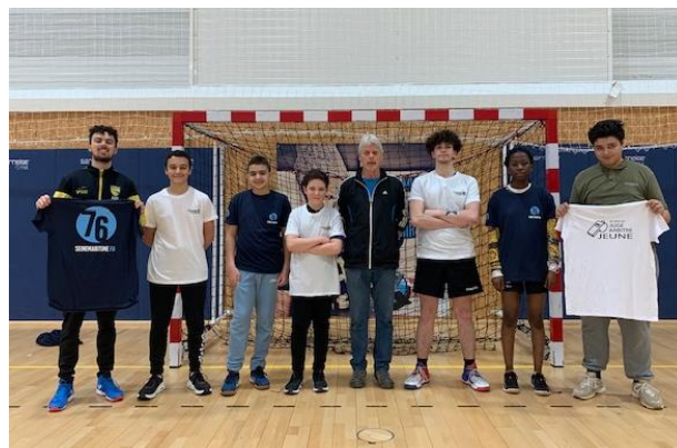
Certifications de JAJ et remise de récompenses aux JAJ Club ayant officié 5 rencontres minimum cette saison. (Teeshirts offert par le Comité 76 et le Département 76)