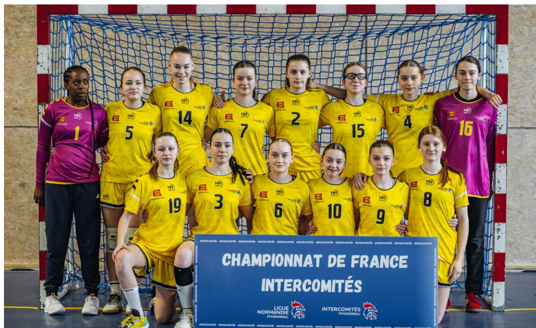
Equipe Regroupement Normandie (14, 61 et 76)